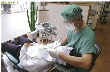
違和感なくかめる入れ歯を目指し治療を行う