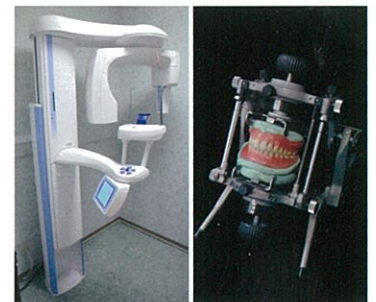
デジタルX線装置とかみ合わせ調整の器具